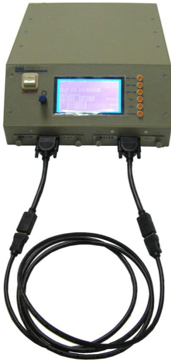
HDMI 1.65Gbps Connection