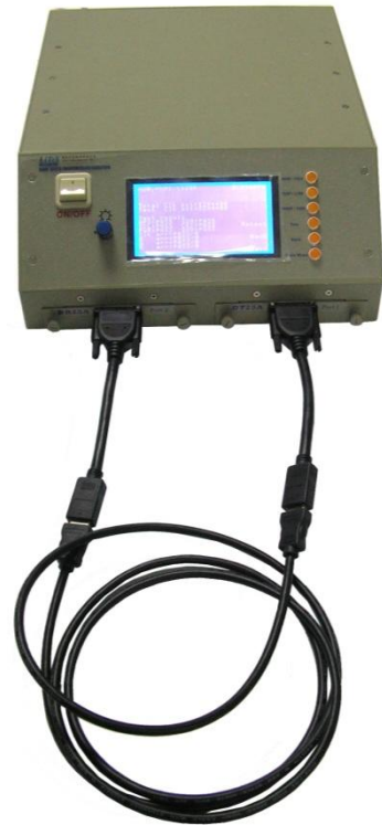
HDMI 2.2275Gbps Connection