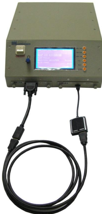
MHL 720P Connection

Note : MHL Dongle 測試，請使用 28AWG 3M HDMI 進行測試，本公司不另外提供。